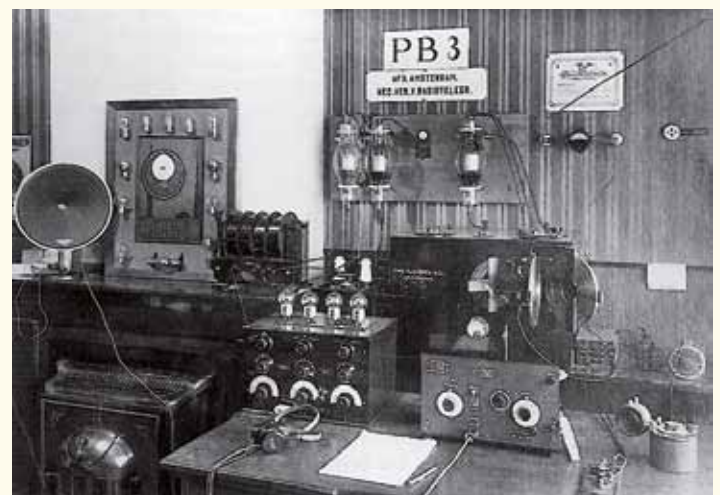
Foto 2 Het station PB3 van de afdeling Amsterdam van de NVVR

De NVVR streed onvermoeibaar voor persoonlijke zendmachtigingen. De zaak kwam in de Tweede Kamer een aantal keren aan de orde, echter zonder resultaat; zij het dat er aan rechtspersoonlijkheid bezittende verenigingen een zendvergunning kon worden verleend. De NVVR en negen afdelingen maakten hier gebruik van. Foto 2 toont het station PB3 van de afdeling Amsterdam. Er golden wel beperkingen. Een ervan was dat er tussen 19.00 en 23.00 uur mocht worden gezonden beneden de golflengte van 200 meter en met maximaal 100 watt in de antenne.