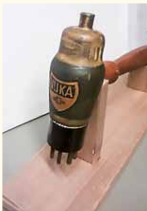
Foto 7 De voorzittershamer van de VUKA