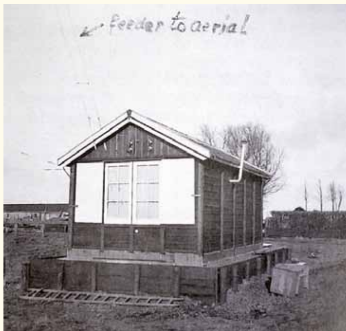
Foto 8 Het station PA0ASD van de Amsterdamse Radio Sociëteit