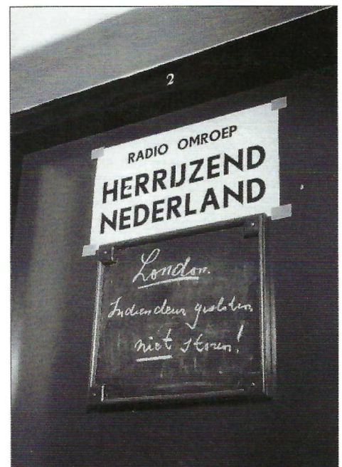
Na de bevrijding van Eindhoven op 18 september 1944 wordt de 'Gehrels zender' gebruikt voor Radio Herrijzend Nederland: 'Hier Herrijzend Nederland, de vrije zender op vaderlandse bodem', op 3 oktober 1944 is het voor het eerst te horen.

kunnen klinken. (bron: speech van H.J. van den Broek, voormalig directeur Radio Herrijzend Nederland, 3 oktober 1947).