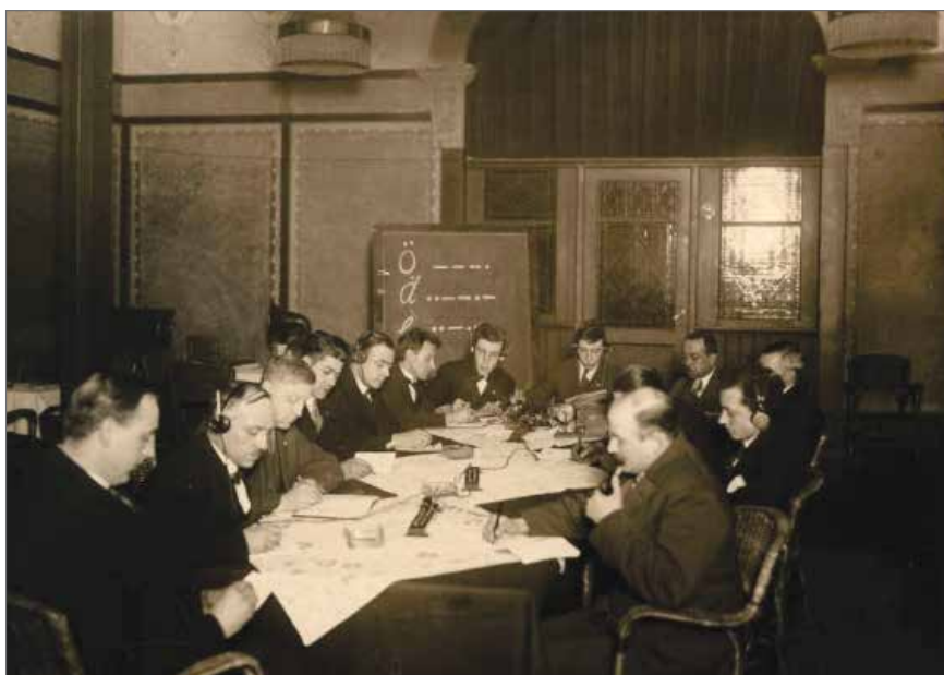
De Amsterdamse Radio Sociëteit 1927 tijdens een morsecursus